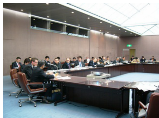
写真 6 ディスカッションアワー

第二日目の夕食後には“Challenges for Future Technologies in Precision Forging”と題して、ディスカッションアワーがもたれた（写真 6）。まず関口が現在までの精密鍛造の歴史及び動向を紹介し、続いて松本が事前に実施した未来の鍛造についてのアンケートの回答結果を説明し、議論の導入とした。小坂田教授は切削加工と塑性加工の比較から新しい加工法のヒントが得られることを提案し、Bay 教授は、摩擦、潤滑の観点から将来の鍛造技術について発表した。