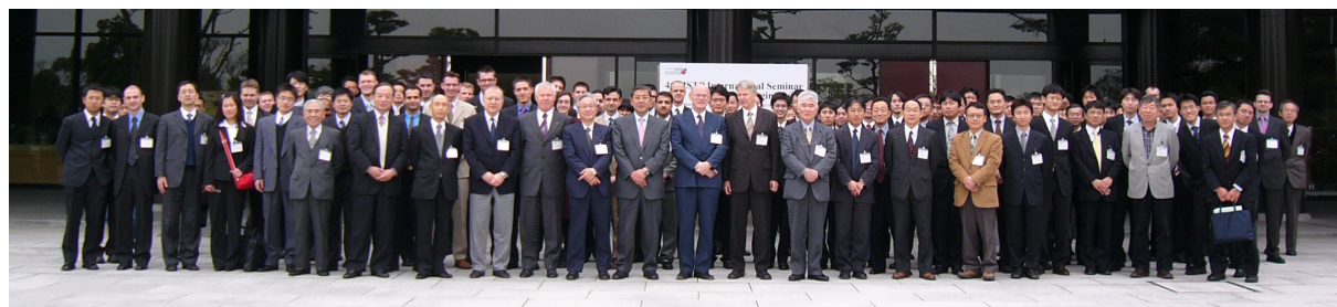
写真1 参加者集合写真（奈良県新公会堂にて）

セミナーには約100名の参加があり、その内、招待参加者は、42名（14ヶ国）であった（表1）（写真1）。若手研究者・技術者の招待は応募時に