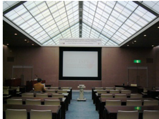
写真 2 セミナー会場（奈良県新公会堂）

3 月 21, 22 日にセミナー（於：奈良県新公会堂）、23, 24 日に 4 社の工場見学の日程で開催された。セミナーでは、受賞講演、基調講演、若手招待参加者による研究発表（口頭、ポスター）及びディスカッションアワーがもたれた（写真 2）。第一日目は、実行委員長の中村 保教授（静岡大学）、古屋元伸氏（（株）ニチダイ社長）の開会の挨拶から始まり、受賞者である小坂田教授による受賞講演、招待講師による 6 件の基調講演、若手招待参加者による 6 件の研究発表と続いた。また夕刻には宿泊先であるホテル日航奈良にて歓迎パーティー（写真 3）が行われ、若手招待参加者の自己紹介があり、参加者の親睦を深めた。第二日目は、受賞者である Niels Bay 教授による受賞講演から始まり、招待講師による 5 件の基調講演、若手招待参加者による 6 件の研究発表と続いた。また昼休みには、若手招待参加者による 17 件のポスター発表が行われた。講演終了後、東大寺、春日大社散策の二コースに分かれて、会場周辺を散策（写真 4）し、夕食後、ディスカッションアワーでは未来の鍛造技術について討論された。