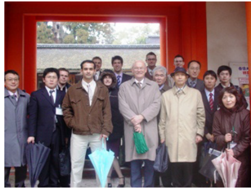
写真 4 春日大社にて